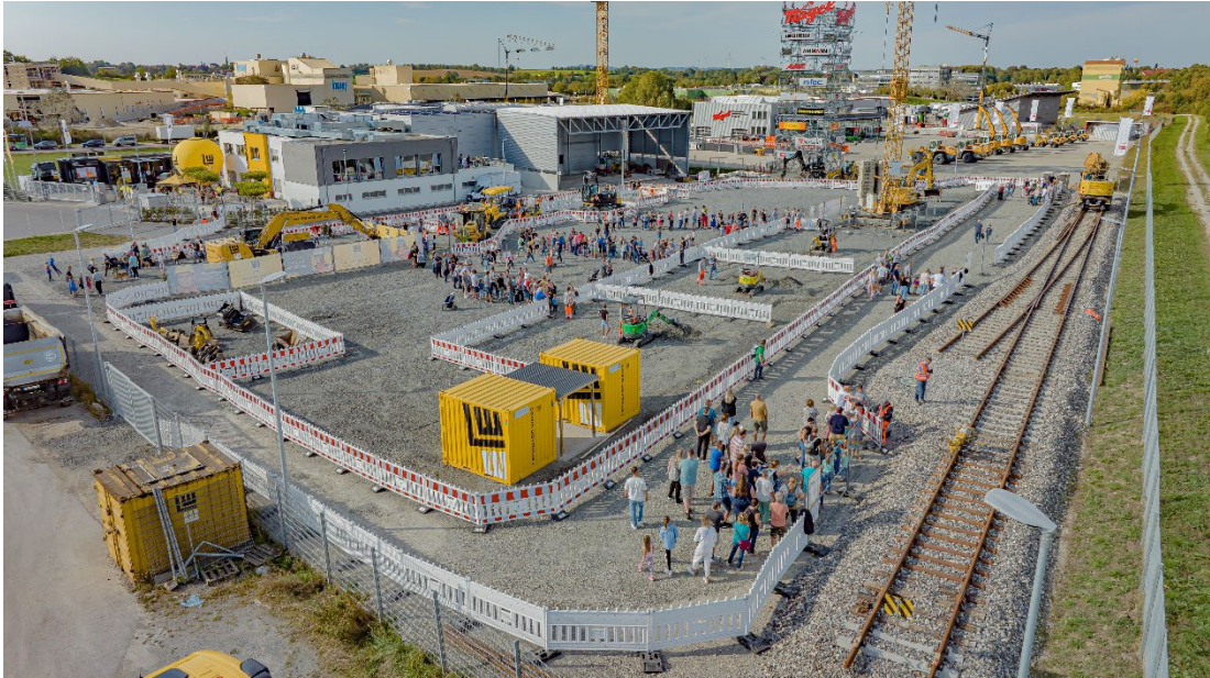
Das Ausbildungszentrum und dessen Trainingsgelände ganz im Zeichen des Events